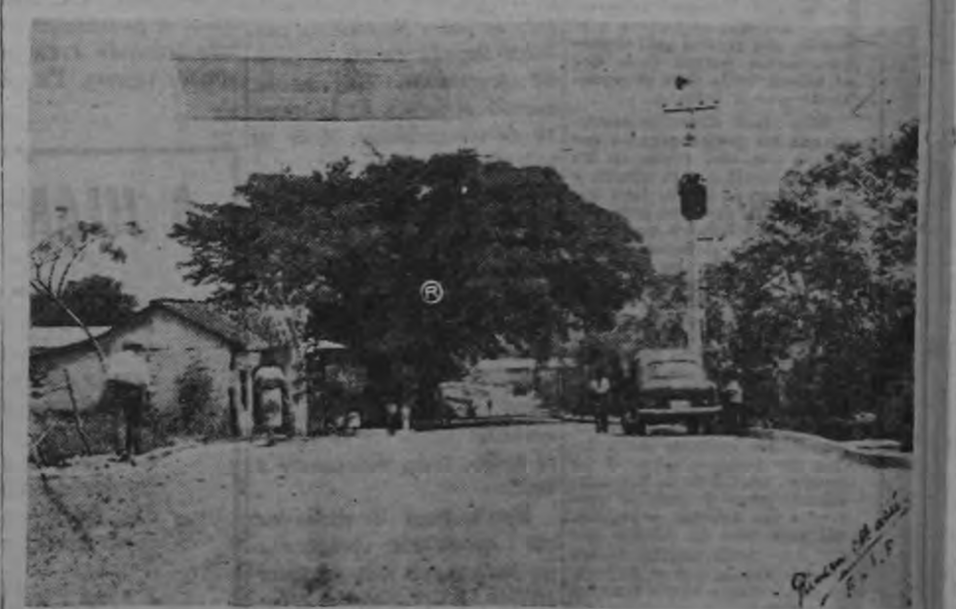
muestra un aspecto parcial de la Alameda Guardia que hoy se inaugura en Alajuela y que será la ruta de salida de la ciudad.

Muy pocos paseos tienen tanta belleza como éste que, arrancando del Parque Juan Santamaría, tal al lado del puente del Ciruelo.